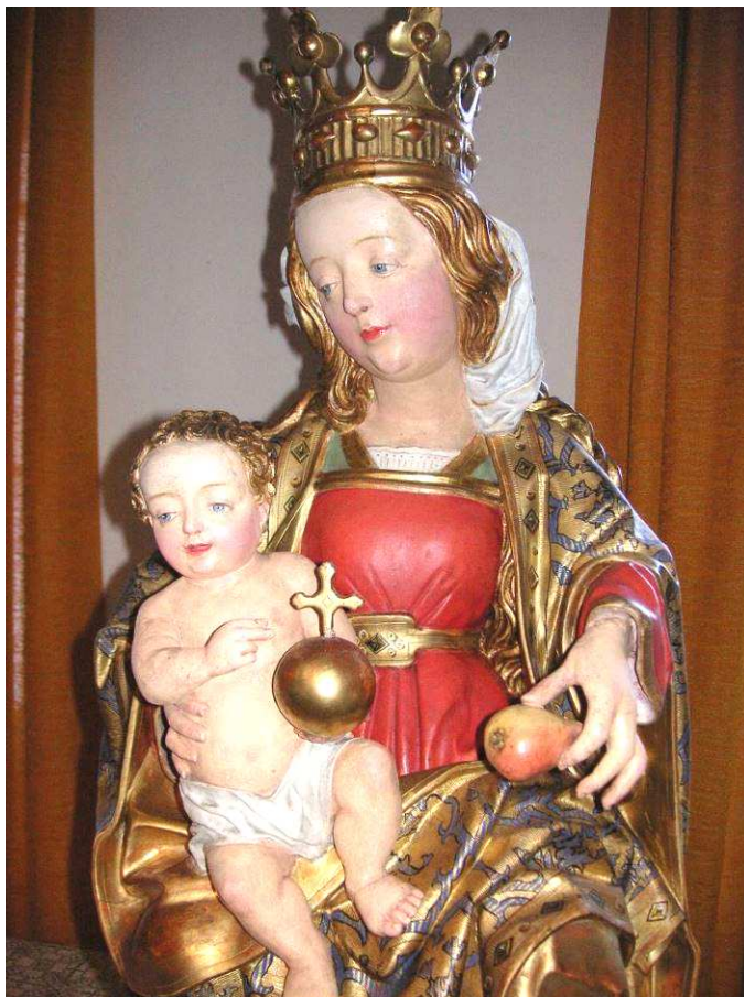
Säbener Mutter Gottes